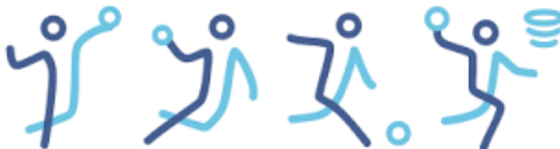
Voleibol Balonmano Fútbol Basket

Deportes de equipo, trabajamos en la base con estos deportes como vehículo de educación, inculcando el juego limpio, esfuerzo, salud, compromiso, respeto, etc. estos deportes ayudan a desarrollar la coordinación, fortalecer músculos, mejoran la agilidad, rapidez y flexibilidad.